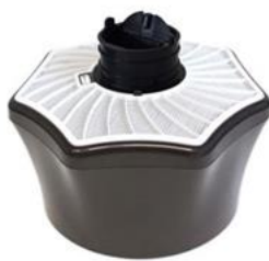
Mosquitaire Pour l'extérieur

134,40 € TTC 14,52 TTC la recharge 42,36 TTC pour 6 mois