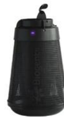
BG-Home Pour l'intérieur

134,40 € TTC 14,52 TTC la recharge 42,36 TTC pour 6 mois