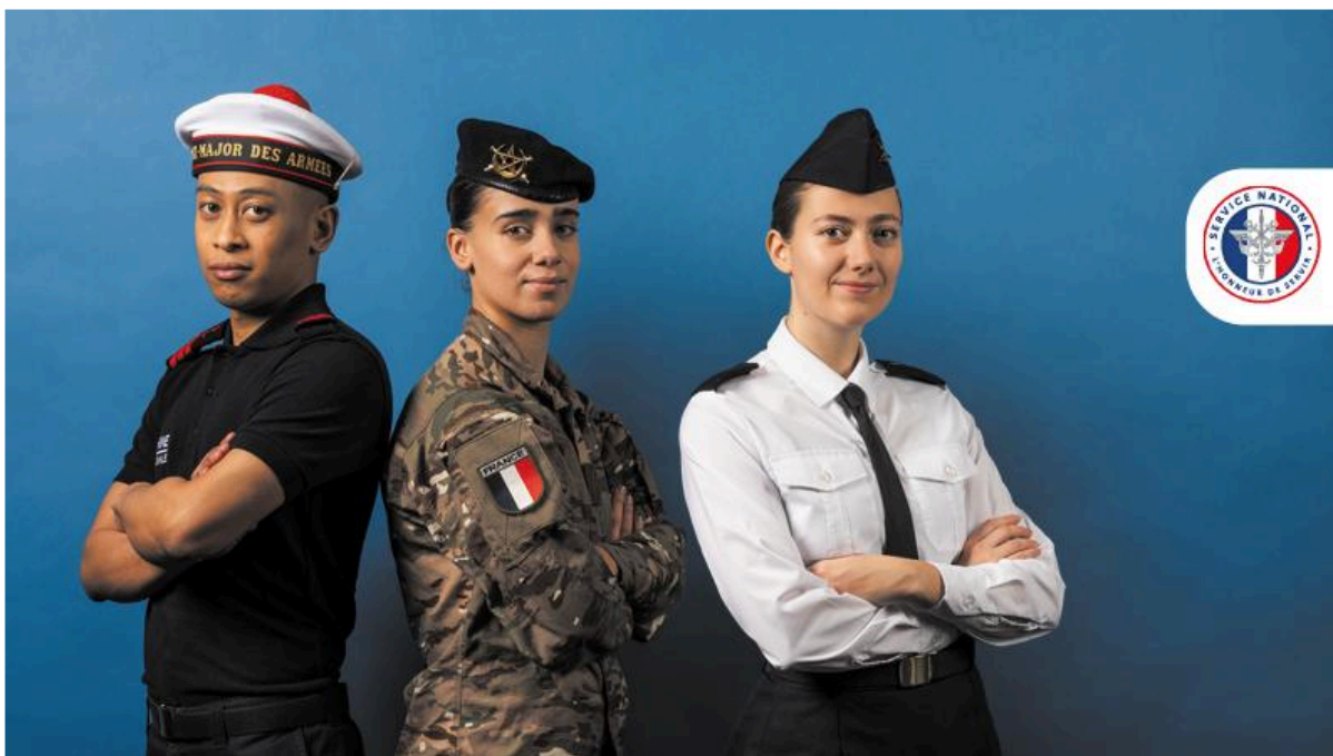
Illustration du dossier service national

Le nouveau service national est officiellement lancé et les inscriptions sont désormais ouvertes pour les jeunes Français de 18 à 25 ans . Volontaire et à caractère militaire, ce dispositif de 10 mois comprend une formation initiale puis des missions sur le territoire national. Accessible sans diplôme , il offre une rémunération , l'hébergement et les repas pris en charge, ainsi que des avantages comme des réductions SNCF. L'objectif est de renforcer l'engagement citoyen et le lien avec la Nation.