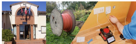
La couverture fibre, à date sur la commune.