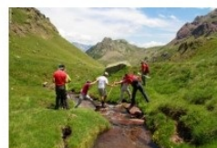
Pyrhando : randonnée pédestre dans les Pyrénées