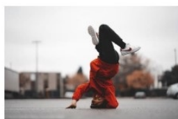
Découverte de la culture Hop Hop