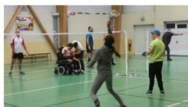
Équipement d'un gymnase