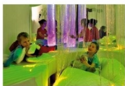
Salles multi-sensorielles pour des séances de relaxation