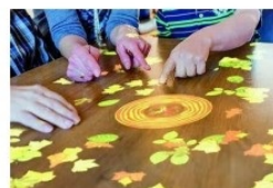
ToverTafels : tables magiques pour favoriser les interactions sociales

L'Opération Brioches de l'AGAPEI aura lieu cette année à Drémil-Lafage sur le marché de Plein Vent le mercredi 18 octobre et le dimanche 22 octobre.