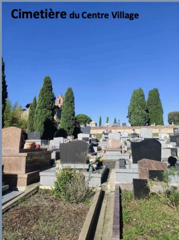
Cimetière du Centre Village